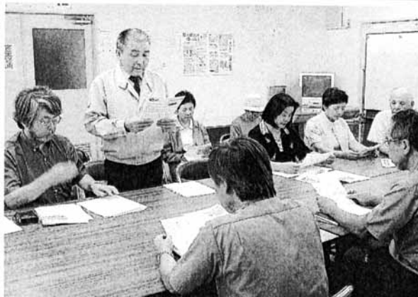
鉄道建設・運輸施設整備支援機構への申し入れ書を 読み上げる住民代表（左から2人目） 水俣市

九州新幹線（新八代―鹿兒島中央間）の騒音調査で、熊本県内の沿線住宅地約二百五十地点の三割以上が環境省の騒音基準を超えた問題で、同新幹線による騒音・振動被害を訴えている水俣市と八代市の住民らが五日、鉄道建設・運輸施設整備支援機構水俣鉄道建設所（水俣市）を訪ね、調査結果公表などを文書で申し入れた。