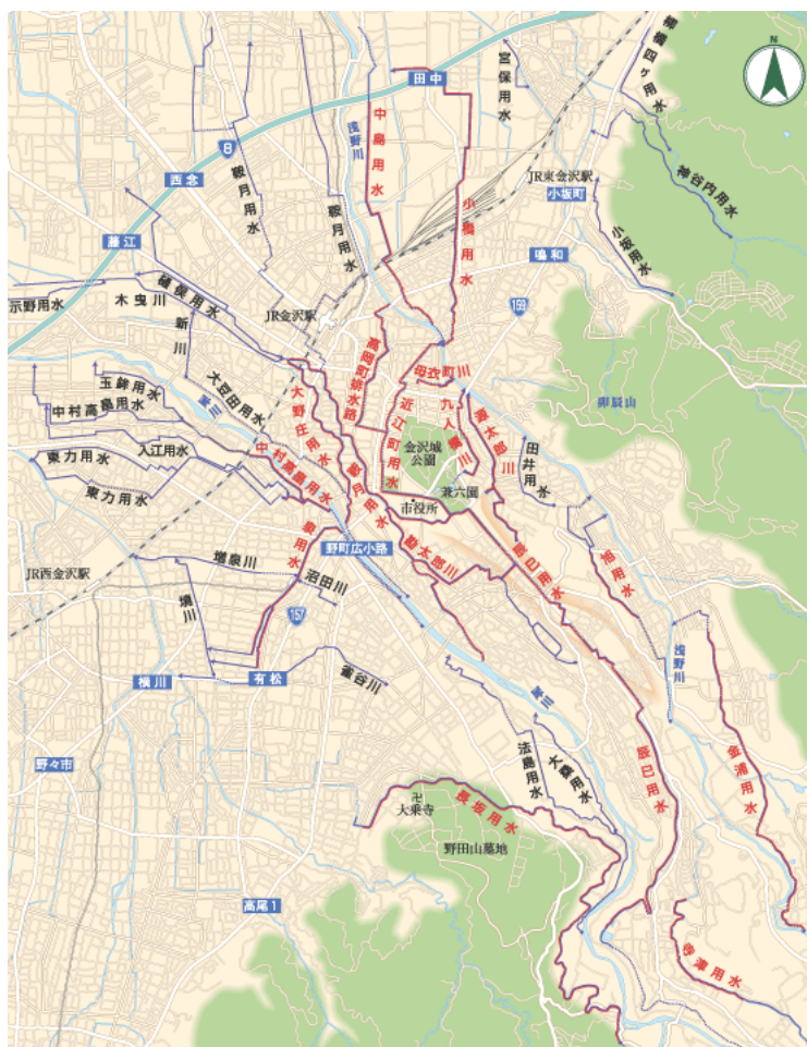
金沢の用水マップ